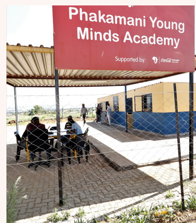
PYMA für Sawabona