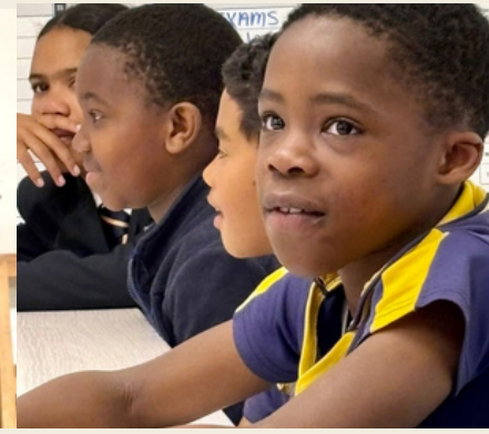
Berufsorientierungs- und Zielsetzungsworkshop