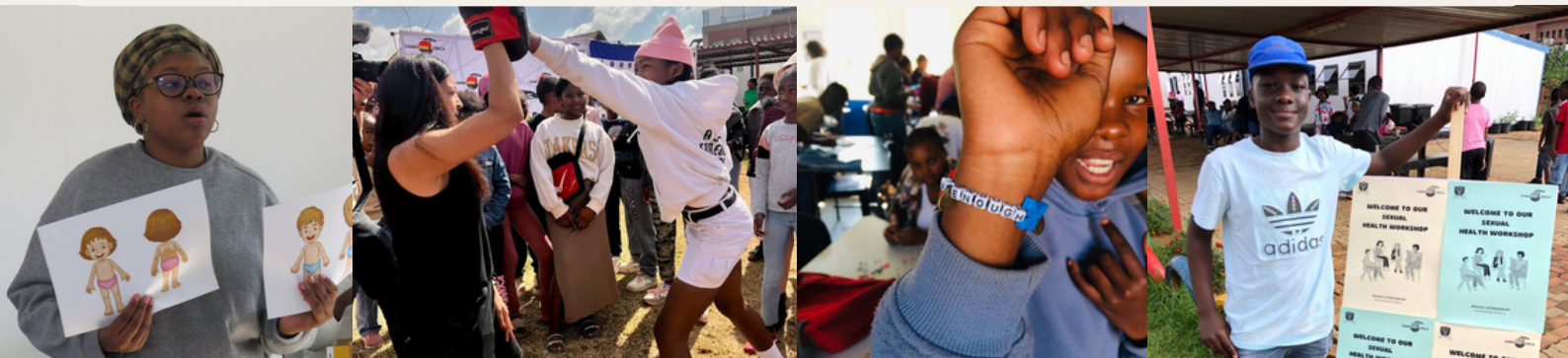
Workshops zur sexuellen Gesundheit und Selbstverteidigung