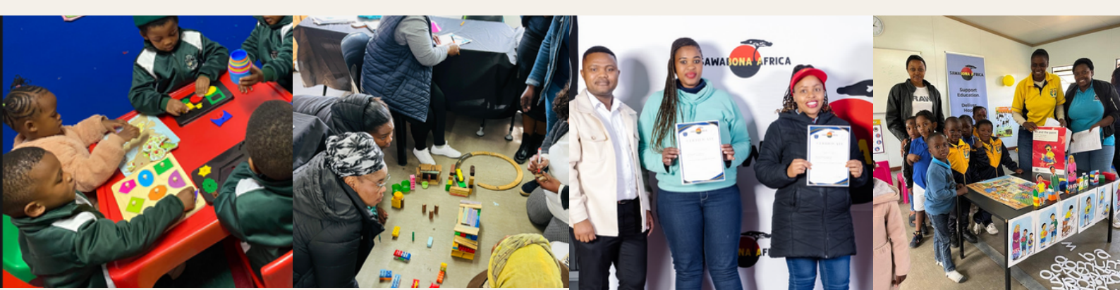
Fortbildungen zur frühkindlichen Entwicklung und Bereitstellung von Spielzeug für benachteiligte Vorschulen