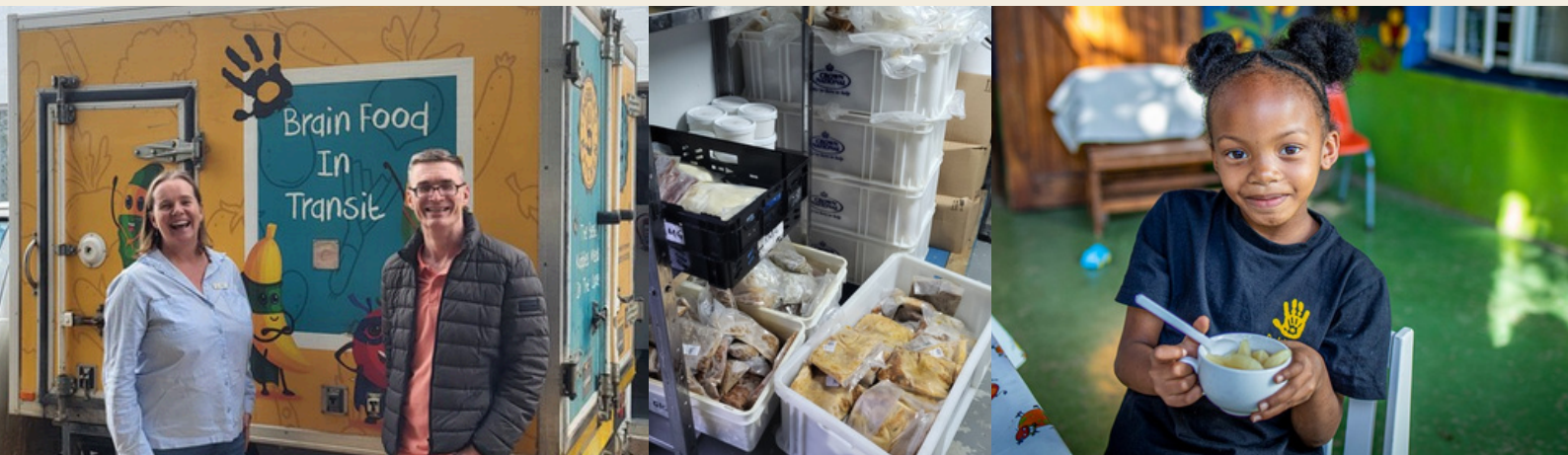
Besuch in der Pebbles Küche