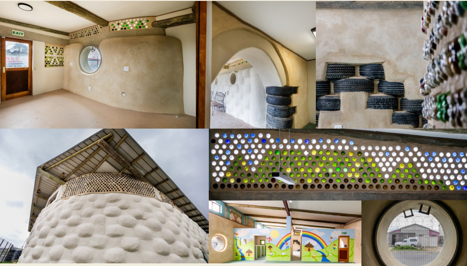
Goal50 setzt sich aus wiederverwerteten Reifen, Flaschen und Bauabfällen zusammen.