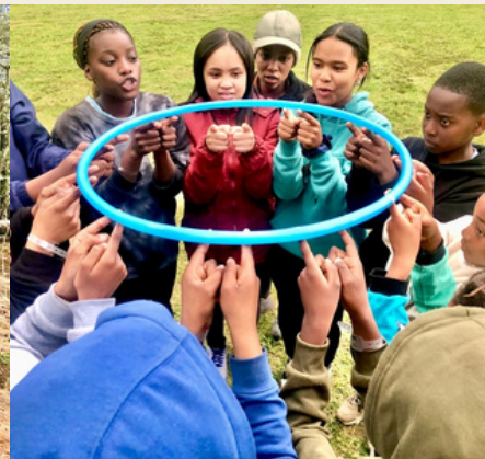
Wanderungen und Busch-Camping waren unvergessliche Höhepunkte für die Kinder