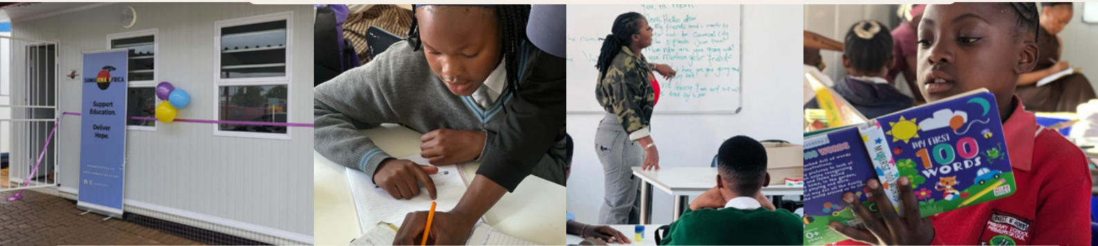
Neue Klassenzimmer, Leseclubs und Nachhilfeunterricht sorgen für bessere Lernergebnisse