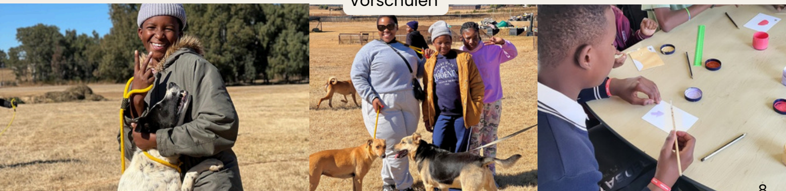
Besuche im Tierheim und Kunstkurse unterstützen die umfassende Entfaltung des Kindes