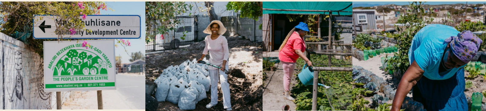
Abalimi Bezekhaya städtische Landwirte „Urban Farmers“