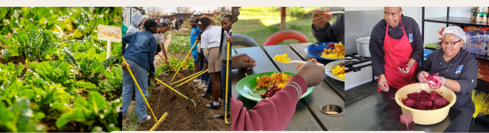
Küche und Garten bieten nahrhafte Speisen und Lernförderung