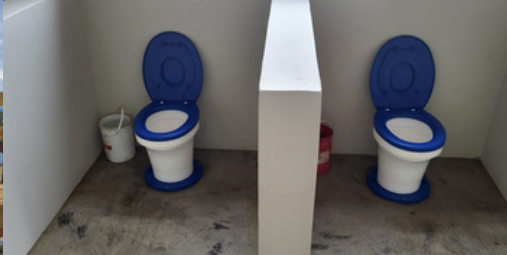
Eindrücke von den modernen Kindergärten