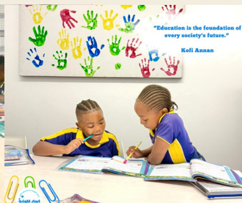
Lernzentrum für Nachhilfe und Unterstützung bei den Hausaufgaben