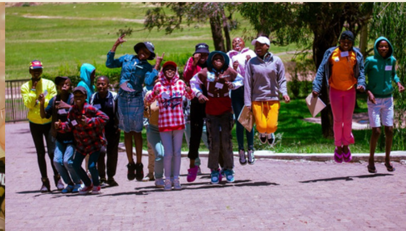
Einblicke in das jährliche Leadership Camp des Jahres 2025