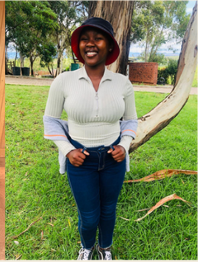
Lernt unsere Paten kennen!